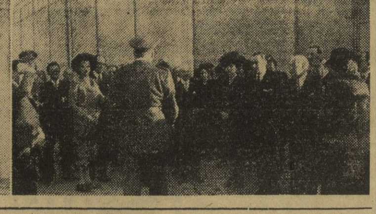
El Excmo. Sr. ministro de Asuntos Exteriores, acompañado del nuncio de S. S. y diplomáticos americanos, visitando el Alcázar de Sevilla y el aeródromo de Tablada, donde fueron recibidos por el jefe de la Segunda Región Aérea, S. A. Real el infante don Alfonso de Orleans.