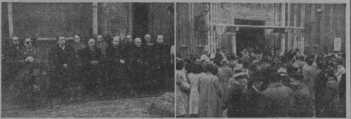
Presidencia de autoridades en los funerales celebrados en la iglesia del Pino, por el alma del Excmo. señor don Miguel Primo de Rivera y Orbaneja, marqués de Estella, y el numeroso público que asistió a los mismos a la salida de la iglesia.