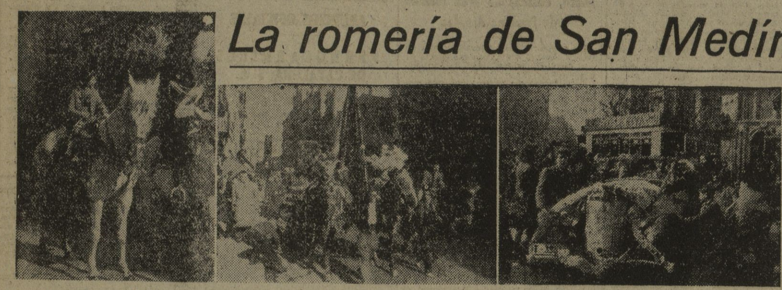
Tres vistas de la tradicional romería a San Medin, que en el día de hoy se ha celebrado por asociaciones gaceras.