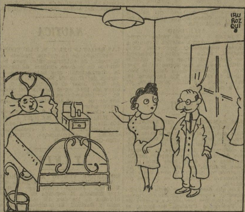
La señora: — Se pasa el día de llorando y sé lo que me falta decir; ¡Eh taxi!... El doctor: — Señora, su marido ha perdido toda esperanza.