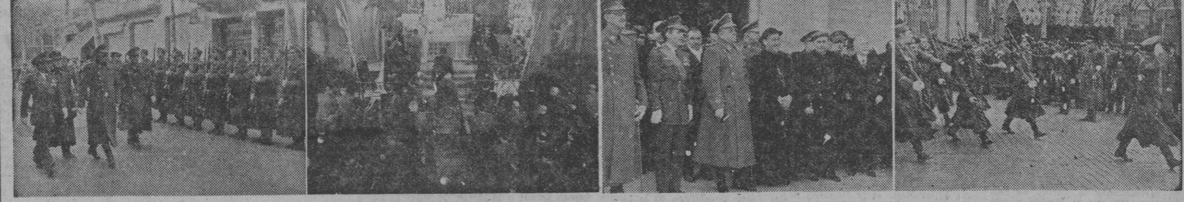
El Arma de Aviación celebró ayer oficialmente la festividad de Nuestra Señora de Loreto, Patrona de la misma. Entre los actos celebrados figuró el que reproduce nuestra información gráfica, 1. El general Moscardó pasando revista a las fuerzas de Aviación que le rindieron honores. — 2. La capilla de la Virgen de Loreto, durante la santa misa. — 3. Las autoridades militares, civiles y religiosas a la salida del templo. — 4. Un momento del desfile de fuerzas. — (Fotos Pérez de Rozas)