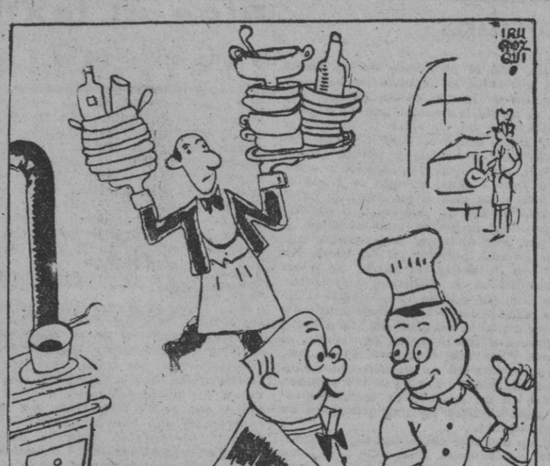
«Le decimos que le ha tocado la Lotería? — No; ahora no.»

Las tropas yanquis han conquistado Ormoc (Leyte)