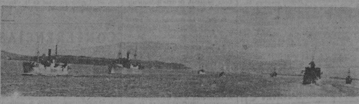
En la costa sud de Noruega, dos convoyes alemanes cruzan su ruta, bajo la eficaz protección de la Marina de guerra del Reich