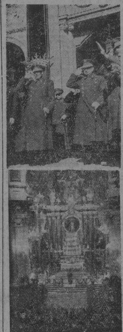
Los excelentísimos señores ministros del Ejército y del Aire, a la salida de la función religiosa celebrada en Santa Bárbara, con motivo de la fiesta de los artilleros, y un aspecto del templo durante la ceremonia

La Laureada de San Fernando, a un cabo de Infantería fallecido