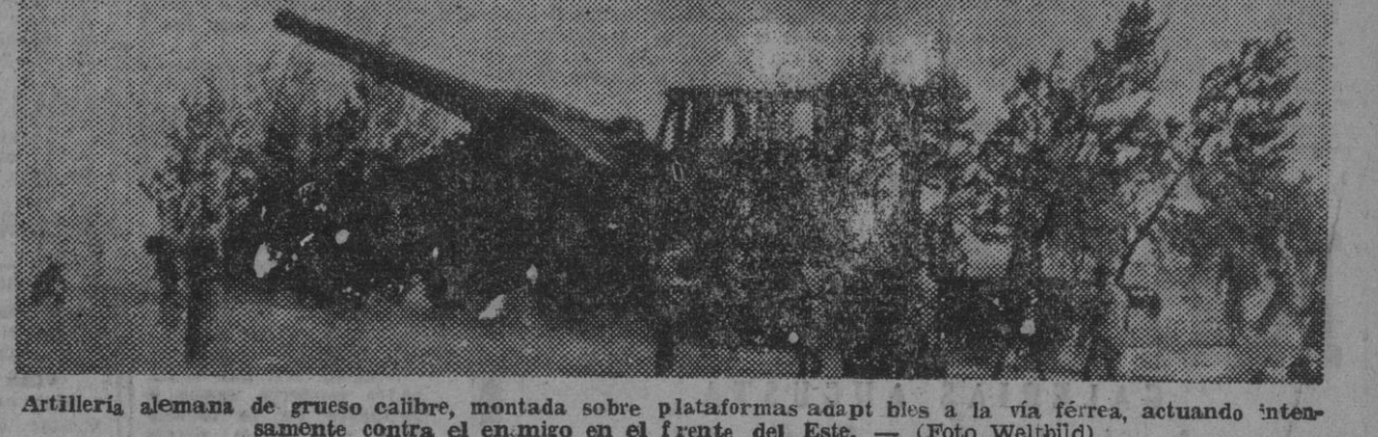
Artillería alemana de grueso calibre, montada sobre plataformas adaptadas a la vía férrea, actuando intensamente contra el enemigo en el frente del Este.