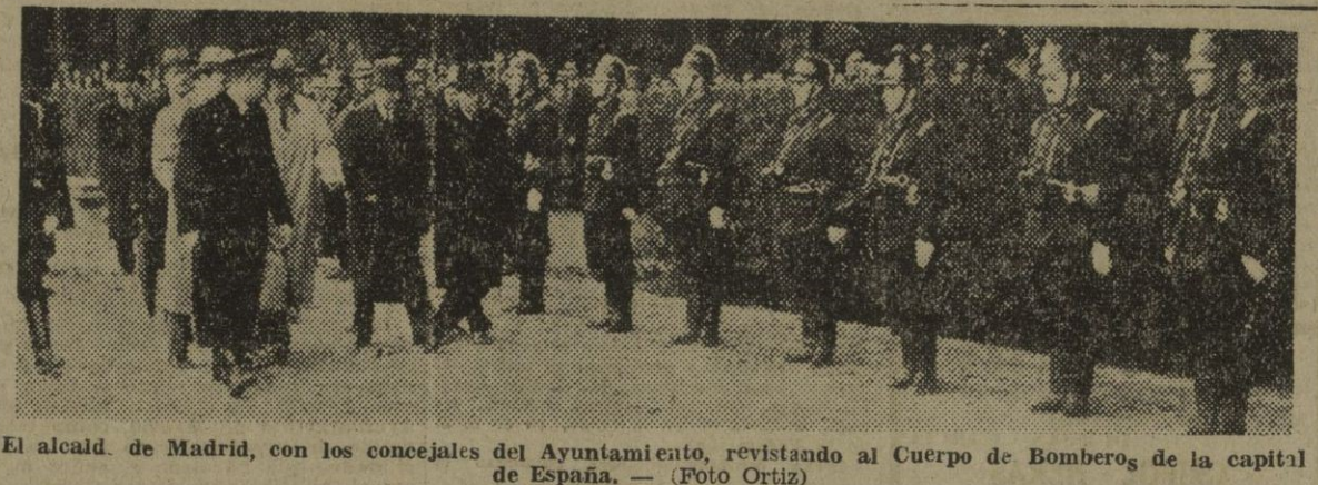
El alcalde de Madrid, con los concejales del Ayuntamiento, visitando al Cuerpo de Bomberos de la capital de España.