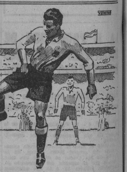
Una excelente jugada...

U. D. Samboyana, 6; R. C. D. Español, 6; C. F. Barcelona «A», 6; C. F. Barcelona «B», 0. R. C. Hospitalet 8; S. E. U., 0. A. D. Juventud; Academia Lara (no presentado éste).