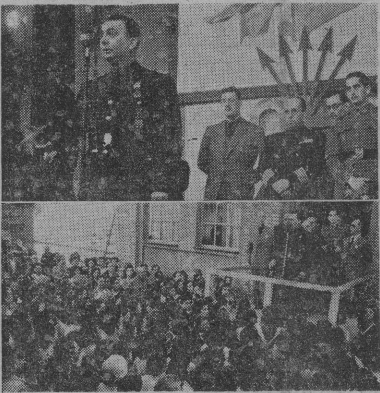
El gobernador civil y jefe provincial del Movimiento, siguiendo, incansable, la campaña de orientación electoral sindical, estuvo ayer en la empresa de Material para Ferrocarriles y Construcciones, S. A., del Pueblo Nuevo (foto superior), en la fábrica Bertrán y Serra

TOKIO, 18. (S. E. T.). — También en las jornadas de lunes y del martes prosiguió la actividad aérea enemiga contra la región de las Molucas.