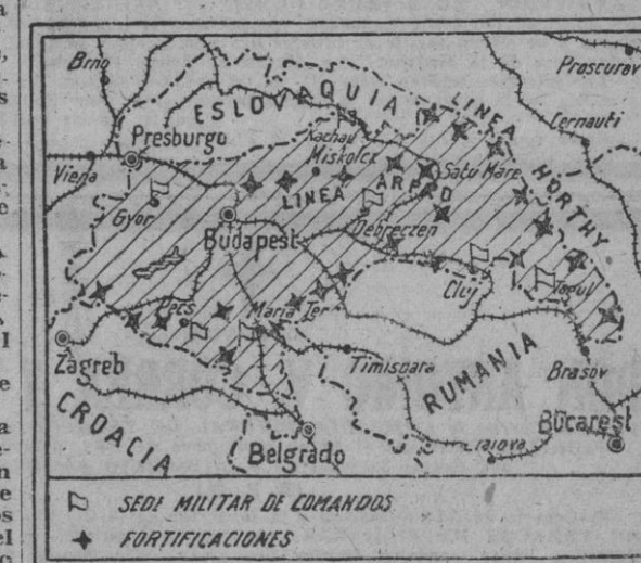
SEDE MILITAR DE COMANDOS FORTIFICACIONES

Ante el angustioso problema que plantea la avanzada rusa, los aliados no aciertan más que a repetir su conocido estribillo: «Derrotar a Alemania; aniquilar a Alemania», pero también este simple enunciado engendra perspectivas que no deben contemplarse con alegre inconsciencia.