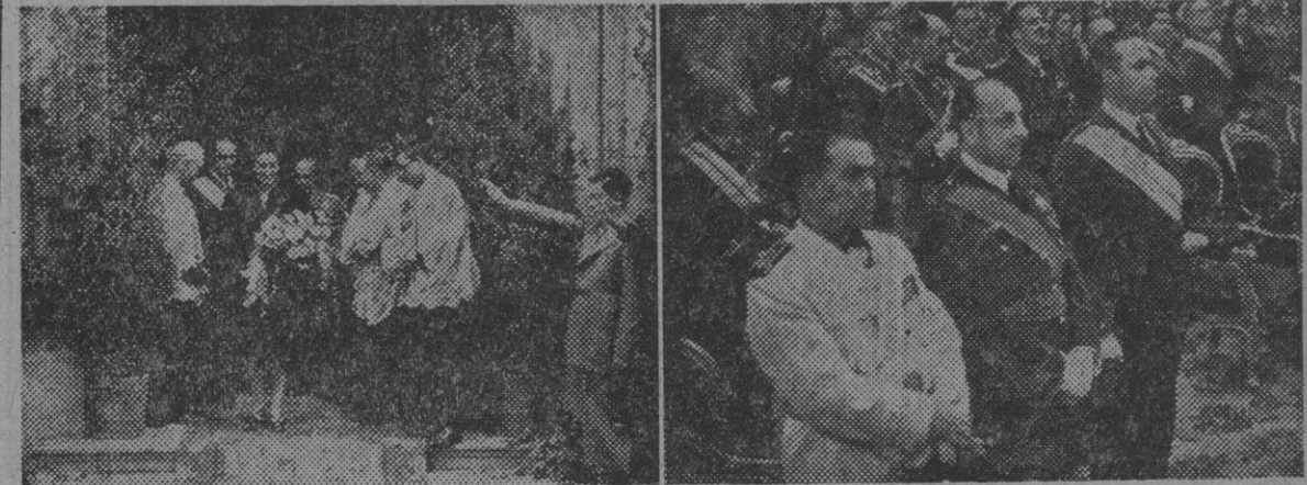
I. La esposa del Caudillo al salir de la función religiosa celebrada en la iglesia del Perpetuo Socorro, con motivo de la fiesta de la Patrona de la Guardia Civil. — II. El ministro de la Gobernación, don Blas Pérez y otras jerarquías, durante el solemne Oficio en honor de la Virgen del Pilar. — (Fotos Ortiz)