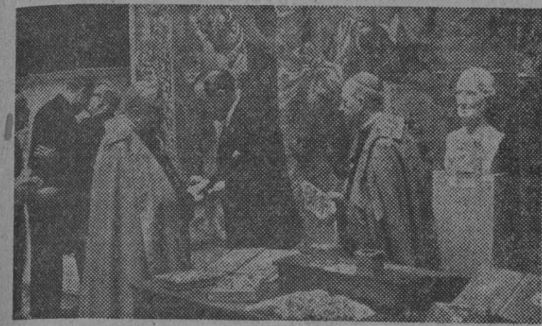
El ministro de Asuntos Exteriores, don José Félix de Lequerica, hablando con el núcleo de S. S. durante la inauguración de la exposición evocadora de la obra de don Martín Fernández Navarrete, que se celebra en el Ministerio de Asuntos Exteriores.