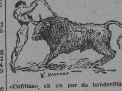
«Cañitas», en un par de banderillas