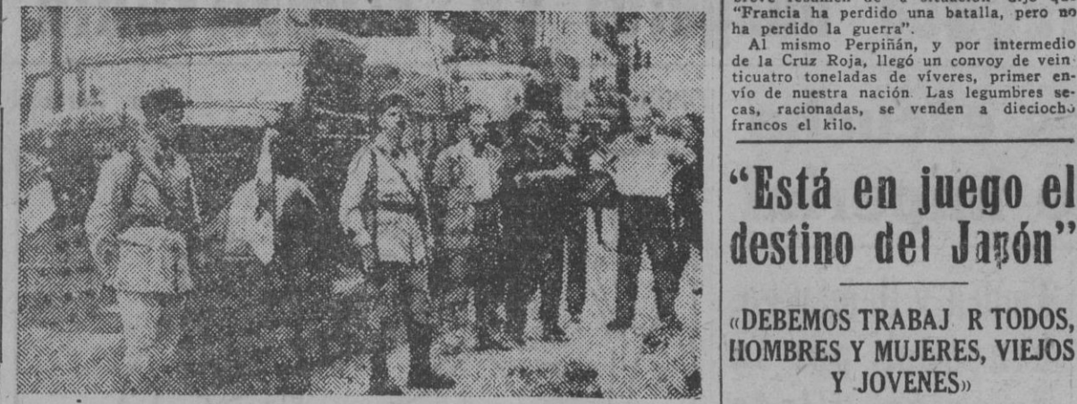
El día 30 de agosto llegó a Perpiñán, por intermedio de la Cruz Roja, un convoy de veinticuatro toneladas de víveres, ofrecidos por España a la población francesa necesitada