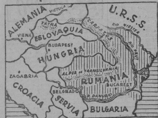
Mapa que muestra la posición de las fuerzas alemanas y los avances de las fuerzas aliadas.

LA GUERRA EN CHINA. De un avión de transporte es sacado, en territorio chino, material automovilístico que ha sido aerotransportado desde la India.