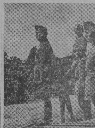
El nuevo presidente del Gobierno húngaro, capitán general Jeza Lakatos, presenciando un desfile de fuerzas combatientes contra el soviet.