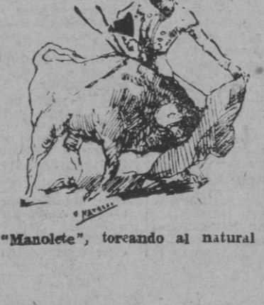
"Manolete", torcando al natural