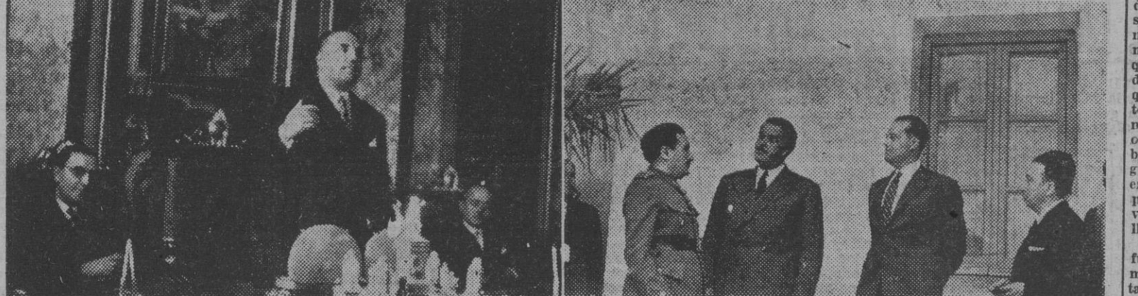
I. El ministro de Justicia, señor Alzola, durante su discurso con motivo de la imposición de las cruces de honor de San Raimundo de Peñafort, a varios miembros de los Colegios Notarial y de Registradores. — II. Los ministros de la Gobernación y de Trabajo, inaugurando el bloque de viviendas protegidas, construido para funcionarios y obreros del Parque de los Ministros.