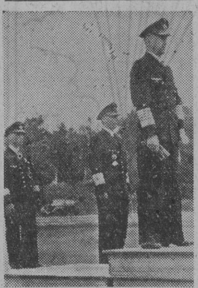
He aquí al gran almirante alemán Doenitz, dirigiendo una alocución a los nuevos marinos del Reich

El primer soldado aliado que ha pisado tierra europea. LONDRES, 8. — Por paloma mensajera se ha recibido el siguiente despacho, procedente del enviado especial de la Agencia Reuter cerca de las tropas aerotransportadas: "Hoy, miércoles, a las 13 horas y detrás de las líneas alemanas: Las poderosas fuerzas aliadas aerotransportadas, que forman la punta de flecha de la invasión de Europa, atacan desde hace muchas horas las instalaciones alemanas. La Armada aerotransportada cubría el cielo en este sector, extendiéndose en una cadena ininterrompida de aviones, hasta el horizonte. Alrededor de mí, dentro de mi campo visual en tierra, y más allá de éste, aterrizaban enjambrados de soldados paracaidistas angloamericanos, poderosamente armados, los cuales, dando sus gritos de guerra, se lanzan a la conquista de los objetivos designados por el Mando. El primer soldado aliado que ha pisado tierra europea es, probablemente, el capitán Frank Lillyman, de Siracusa (Nueva York). Inmediatamente después de él aterrizó el comandante Jorg Griswold Jasper." — Efe.