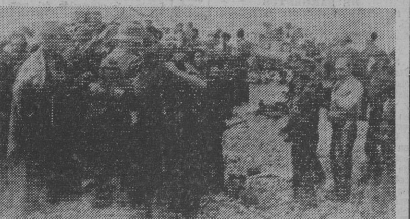
Aspecto de la ciudad

El éxito alemán es tanto más notable cuanto que las dos divisiones norteamericanas aerotransportadas fueron constantemente reforzadas en la jornada de ayer por mar, con carros y municiones. El intento británico de avance en la gran cabeza de puente al oeste de la desembo-