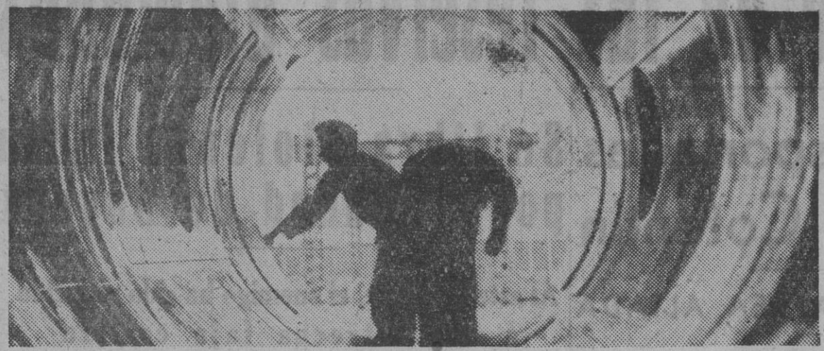
Este enorme cilindro, en cuyo interior trabajan los hombres, es uno de los cañones del máximo calibre que guardan las fortificaciones atlánticas