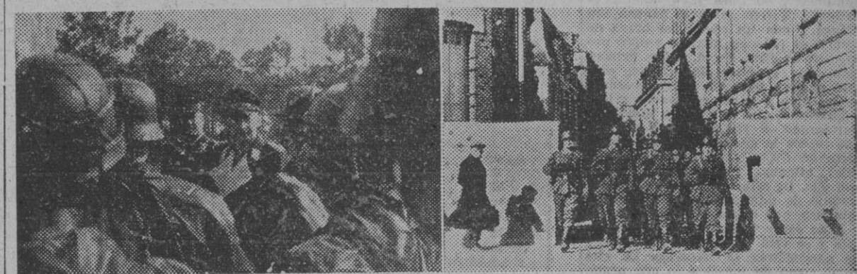
I. El jefe de los paracaidistas alemanes de las unidades del Este, general Student, revistando a una de las unidades que guardan territorios ocupados. — II. Grupo de soldados pertenecientes a unidades de combate, desfilando entre las grandes barreras antitanques de una ciudad francesa de la costa del Atlántico.