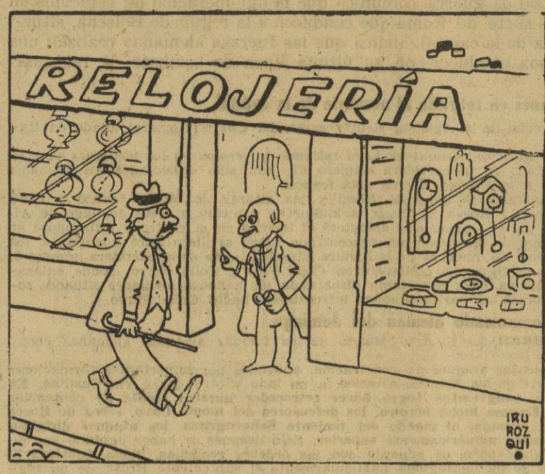
El relojero: — ¿Me hace el favor de decirme qué hora es?

A pesar de la violenta reacción roja y sus repetidos contraataques