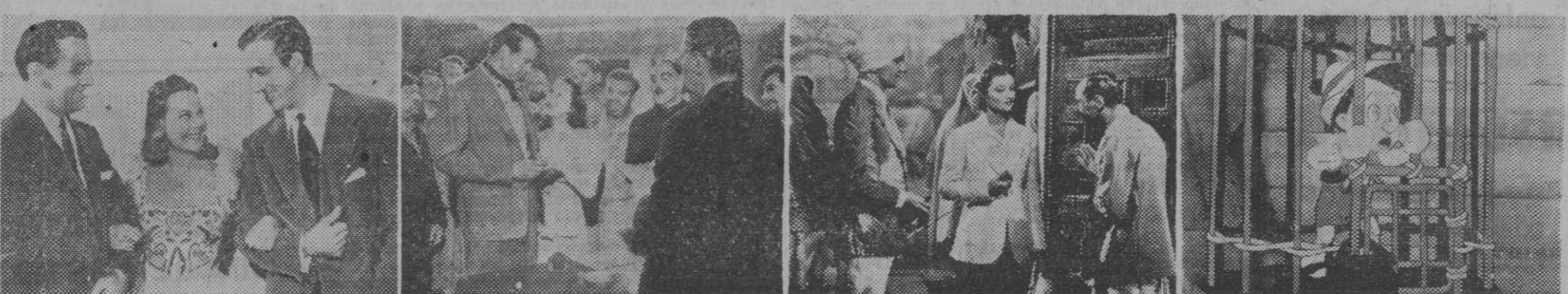
He aquí varias escenas de «Tú serás mío», «El vaquero y la dama», «Vinieron las lluvias» y «Pinocho», que hoy se estrenan en los cines Fantasio, Capitolio y Metrópoli, Coliseum y Aristos y Plaza, respectivamente