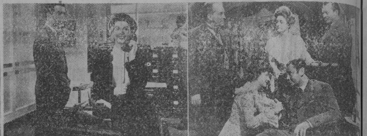
Rosalind Russell y Fred Mac Murray, simpáticos intérpretes de "Ella y su secretario", que el cine Kursaal estrena hoy. — Una escena de "La loba", film interpretado por Bette Davis, que le valió un primer premio de interpretación, y que el cine ma Astoria presentará hoy a su público