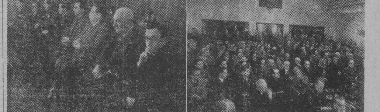
Bajo la presidencia del Excmo. señor gobernador civil y jefe provincial del Movimiento, camarada Correa, se celebró ayer, tarde, la solemne sesión inaugural de las taras científicas del Colegio Provincial de Farmacéuticos. En nuestra información gráfica: la presidencia del acto y un aspecto del público que llenaba el salón del mencionado Centro.