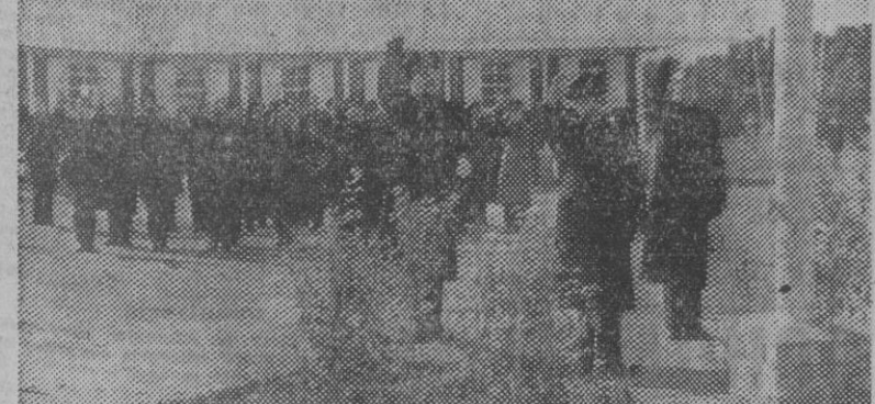
Con asistencia del ministro secretario general del Movimiento, camarada Arrese, se ha celebrado el acto inaugural del campamento escuela de los falangistas juveniles de Franco, uno de cuyos momentos recoge nuestra fotografía.

El sacerdote es maestro, médico y pastor de las almas. Para conseguir aptos sacerdotes ayuda al Seminario. Para donativos: Palacio Episcopal y Seminario Conciliar, Diputación, 231.