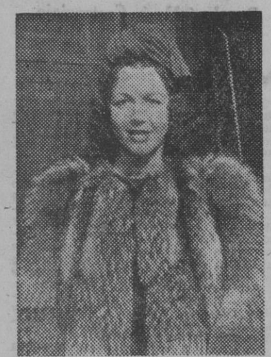
FIGURA DE LA DANZA

Ilse Meudtner, primera bailarina de la ópera nacional de Berlín, que mañana dará un interesante recital de danza en el Palacio de la Música