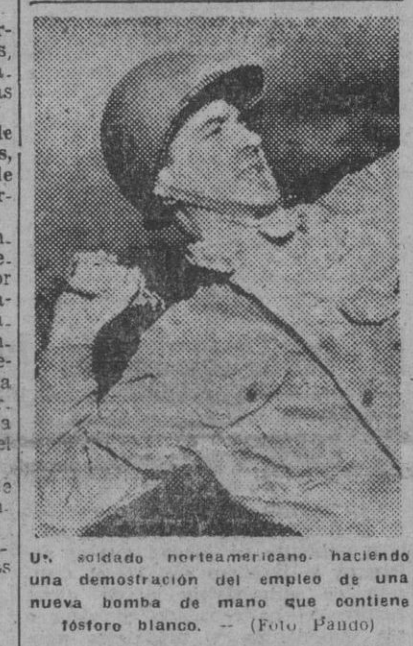
Un soldado norteamericano haciendo una demostración del empleo de una nueva bomba de mano que contiene téstero blanco.