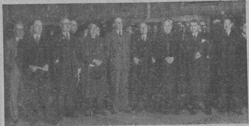
Las autoridades de nuestra ciudad, presididas por el Excmo. Sr. capitán general de la IV Región, admirando los nuevos tapices, adquiridos por el Ayuntamiento y que han sido expuestos en el Salón de Ciento

El Gobierno sancionará con el máximo rigor las negligencias en el servicio ferroviario. Se crea en Barcelona un Conservatorio Superior de música y demacliación