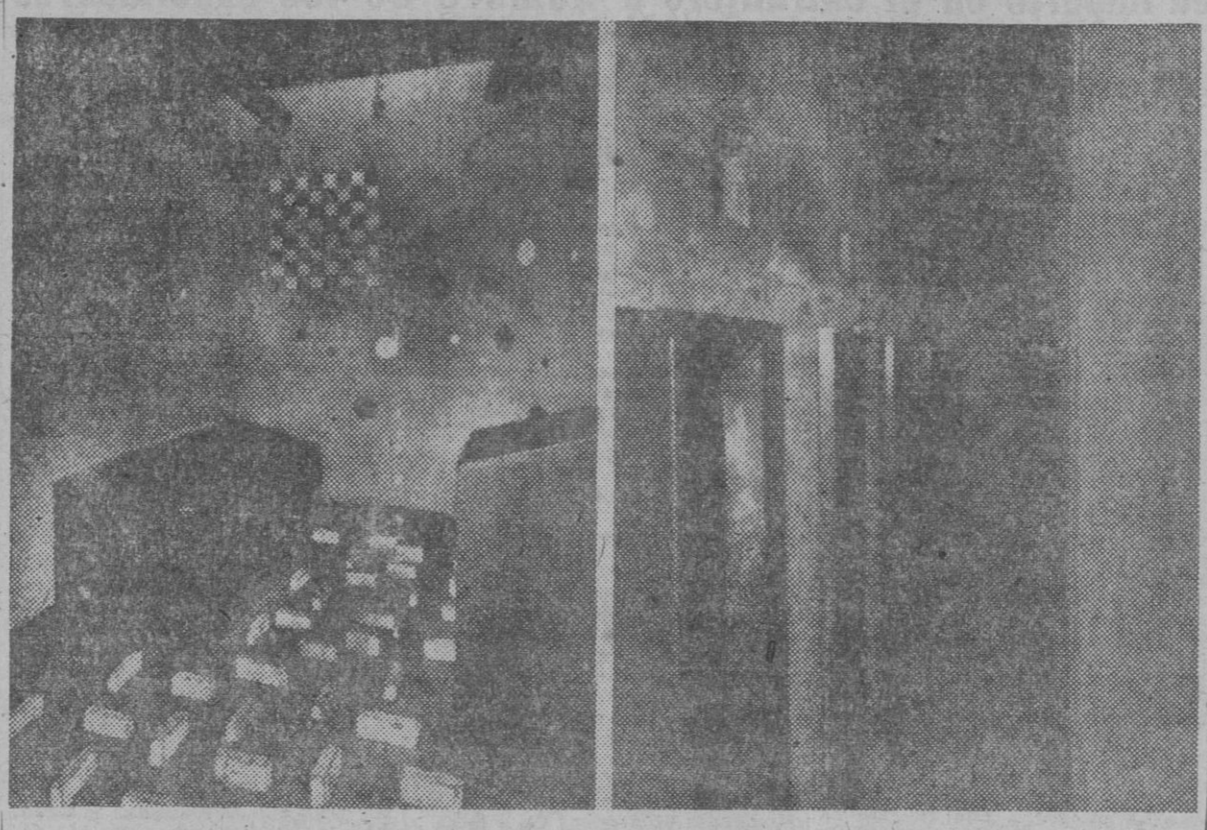
Una de las celdas «alucinantes» de la checa de la calle de Vallmajor, y, en segundo término, el pasillo que daba acceso a las terribles celdas llamadas «neveras».