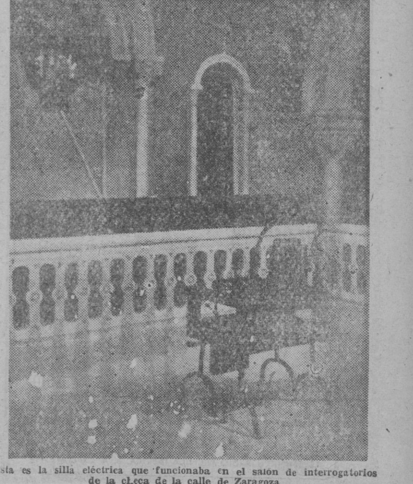
Esta es la silla eléctrica que funcionaba en el sótano de interrogatorios de la checa de la calle de Zaragoza