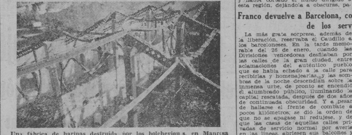
Una fábrica de harinas destruida por los bolcheviques, en Manresa

haya que agregar la ingente relativa a los Bancos particulares y cajas fuertes que saquearon. El importe total de salarios entregados a los "trabajadores pasivos" hasta 31 de mayo de 1937 ascendió tan sólo a 879 millones de pesetas.