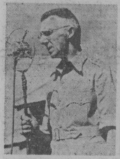
El teniente general Stilwell, jefe de las fuerzas norteamericanas en China, Birmania y la India, dirigiéndose por radio a los soldados de las fuerzas expedicionarias

Un senador yanqui se muestra contrario a la alianza militar con Inglaterra y Rusia