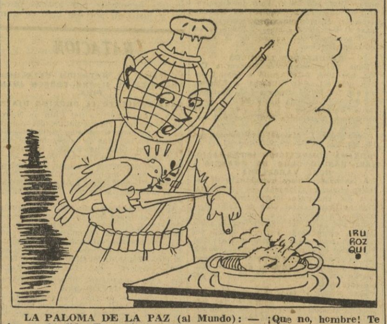
LA PALOMA DE LA PAZ (al Mundo): — ¡Que no, hombre! Te has confundido. El ramito que llevo no es de perejil, es de olivo...

El camarada Arrese saluda al octavo Consejo Nacional de la Sección Femenina