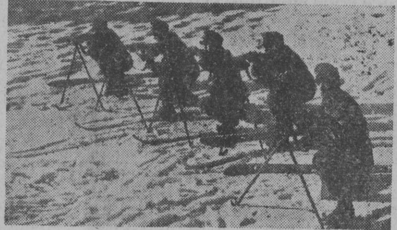
Soldados esquiadores del ejército alemán, haciendo prácticas de tiro con el equipo completo de campaña.