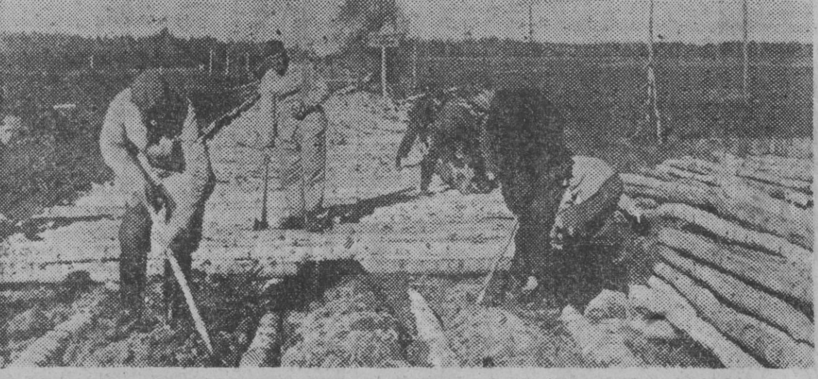
Las dificultades de transporte por carretera en las regiones del Norte, que atraviesan con frecuencia terrenos pantanosos, son vencidas construyendo firmes de madera, como el que en nuestra fotografía muestran las tropas de Ingenieros del III Reich.