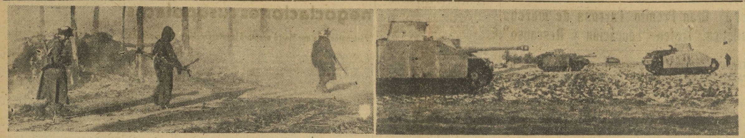
I. Tropas especiales de Granaderos blindados toman por asalto una localidad antes de que se dispersen las nubes de humo de las explosiones de artillería. — II. Cañones de asalto, preparados para combatir en una acción de gran envergadura.