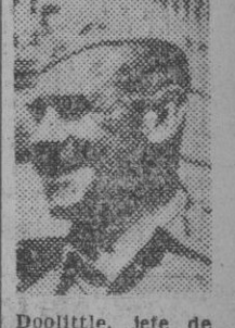
Doolittle, jefe de las fuerzas aéreas norteamericanas en Inglaterra