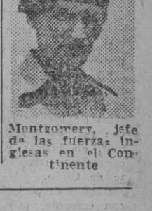
Montgomery, jefe de las fuerzas inglesas en el Continente