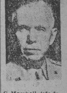
C. Marshall, jefe de Estado Mayor del ejército americano