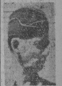
Tedder, jefe de las fuerzas aéreas de la invasión