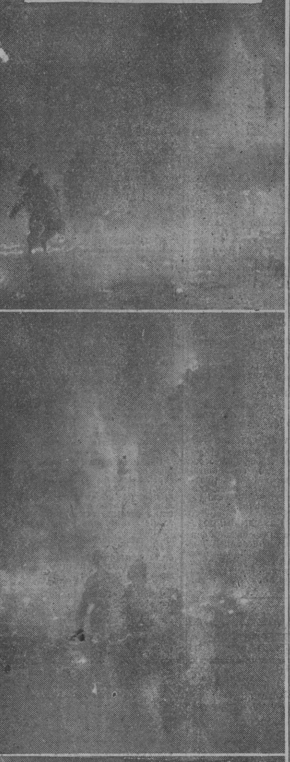
En los ataques de terror que realizan los aliados casi diariamente sobre las ciudades alemanas, el empleo de fósforo líquido pone una nota de espantoso monstruosidad. El fósforo líquido arrojado entre bombas destructoras e incendiarias no tiene parangón con ningún otro procedimiento bélico conocido hasta el día. Su poder aniquilador y mortífero ha superado a la terrible arma de los gases.