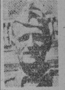
Spaatz, jefe de las fuerzas estratégicas norteamericanas en Europa