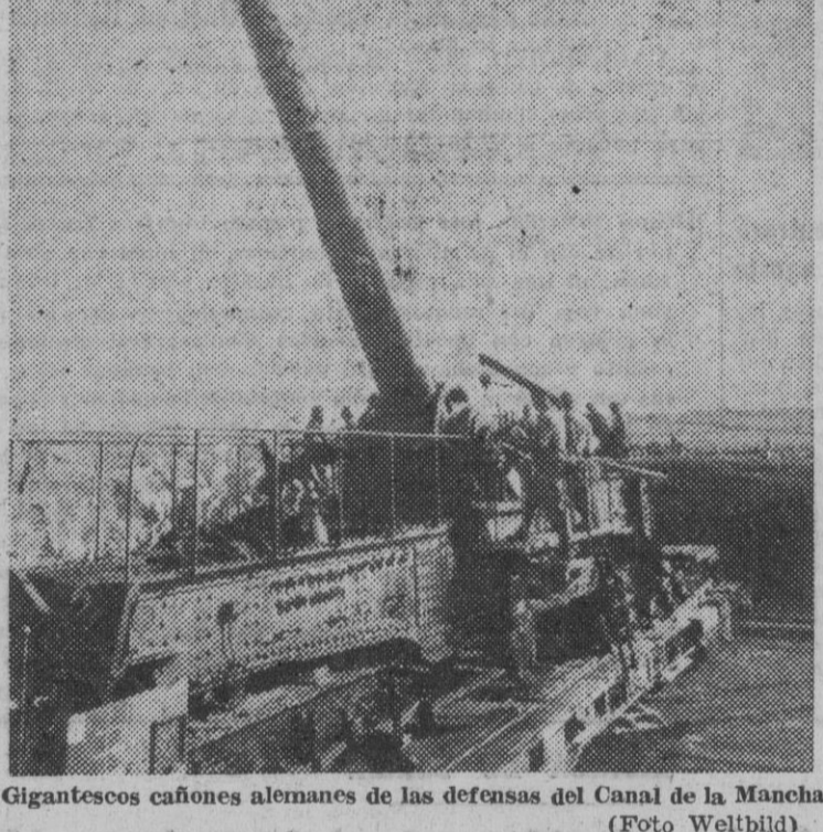
Gigantescos cañones alemanes de las defensas del Canal de la Mancha.