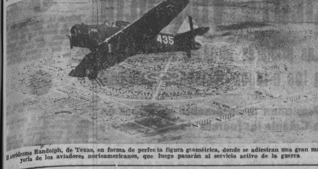
El aeródromo Randolph, de Texas, en forma de perfecta figura geométrica, donde se adiestran una gran mayoría de los aviadores norteamericanos, que luego pasarán al servicio activo de la guerra.