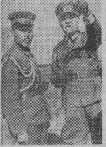
El agregado militar japonés, nombrado general mayor a primeros de año, Komatsu, durante su reciente visita al frente oriental.

Turquia como los buques franceses refugiados en sus puertos ANGORA, 15. — Han terminado favorablemente las negociaciones para la venta a Turquía de los barcos franceses refugiados en puertos turcos. El contrato definitivo será firmado dentro de poco tiempo en Vichy, según se anuncia oficialmente. — Efe.