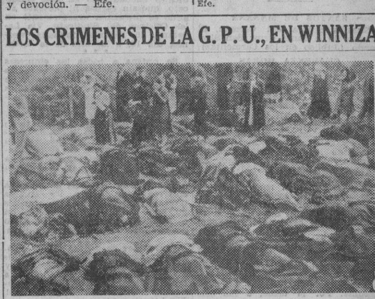
Nuevas fosas comunes por los vecinos de Winniza, en el distrito general de Schitmir. Fueron cavadas 1938-1941, y contienen miles de ucranianos de ambos sexos, y entre ellos numerosos niños. Las exhumaciones oficiales han sido iniciadas. Un aspecto de las víctimas en filas para la identificación.

LOS CRIMENES DE LA G. P. U., EN WINNIZA Nuevas fosas comunes por los vecinos de Winniza, en el distrito general de Schitmir. Fueron cavadas 1938-1941, y contienen miles de ucranianos de ambos sexos, y entre ellos numerosos niños. Las exhumaciones oficiales han sido iniciadas. Un aspecto de las víctimas en filas para la identificación.