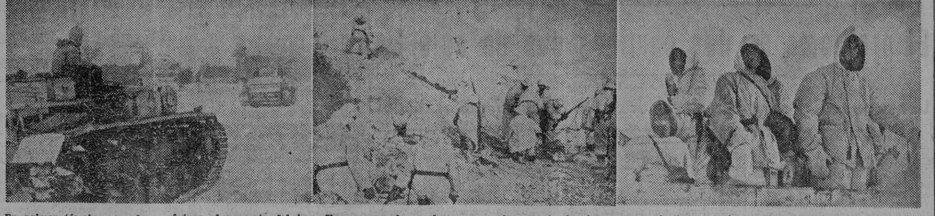
En primer término, cazadores alpinos al noroeste del lago Ilmen; granaderos alemanes en el momento de atacar a unos fortines enemigos...

Sólo se libran combates locales en el frente tunecino