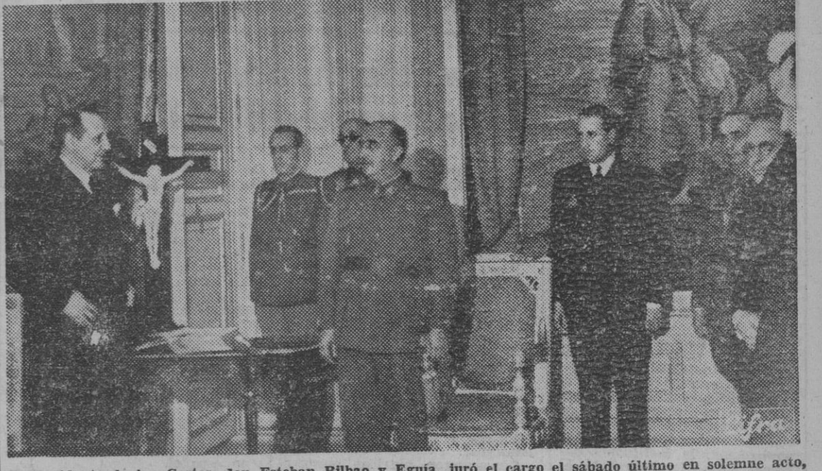
El Presidente de las Cortes, don Esteban Bilbao y Eguía, juró el cargo el sábado último en solemne acto, ante el Caudillo y en presencia del Gobierno. — (Foto Cifra).