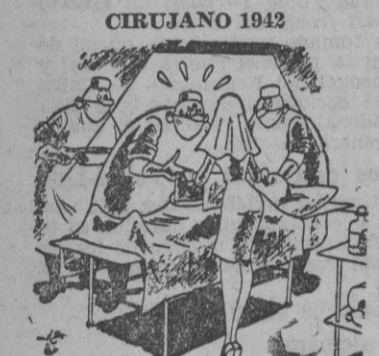
EL OPERADOR. — ¡Corazón, hígado, pulmones, estómago, pero un flete, maldita sea, ni por asomo!...

En su lugar se restablece el día festivo semanal, por lo cual deberán presentarse todos los auto-taxis en el Negociado de Circulación con el fin de serles fijada la hora correspondiente.