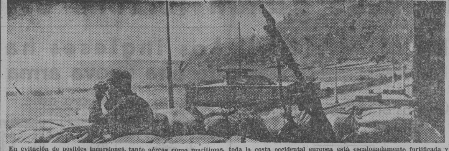
En evitación de posibles incursiones, tanto aéreas como marítimas, toda la costa occidental europea está escalonadamente fortificada y con vigilancia permanente.