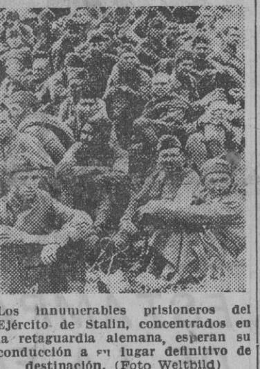
Los innumerables prisioneros del Ejército de Stalin, concentrados en la retaguardia alemana, esperan su conducción a su lugar definitivo de destino.