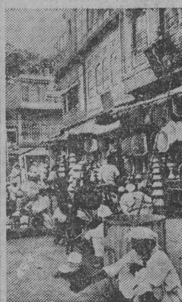
Una calle comercial de la India con sus típicos puestos

MONTEVIDEO, 28. — El canciller Guani ha aplazado su viaje a Washington, previsto para fines de agosto. Guani marchará a Chile en septiembre y regresará a Uruguay antes de las vacaciones de su residencia veraniega, a la cual regresó anoche. — Efe.