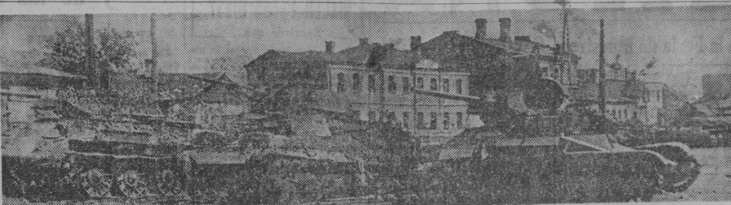
Entre el material de guerra recogido por los alemanes en sus avances victoriosos en el frente del Este, destacan numerosos tanques soviéticos, pesados y semipesados, que se encuentran, sobre todo, cercanos a los pueblos y centros fabriles, destruidos por la artillería antitanque alemana.