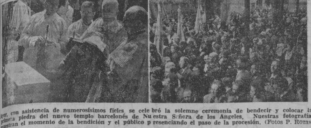
Con asistencia de numerosos fieles se celebró la solemne ceremonia de bendecir y colocar la primera piedra del nuevo templo barcelonés de Nuestra Señora de los Angeles. Nuestras fotografías muestran el momento de la bendición y el público presenciando el paso de la procesión.