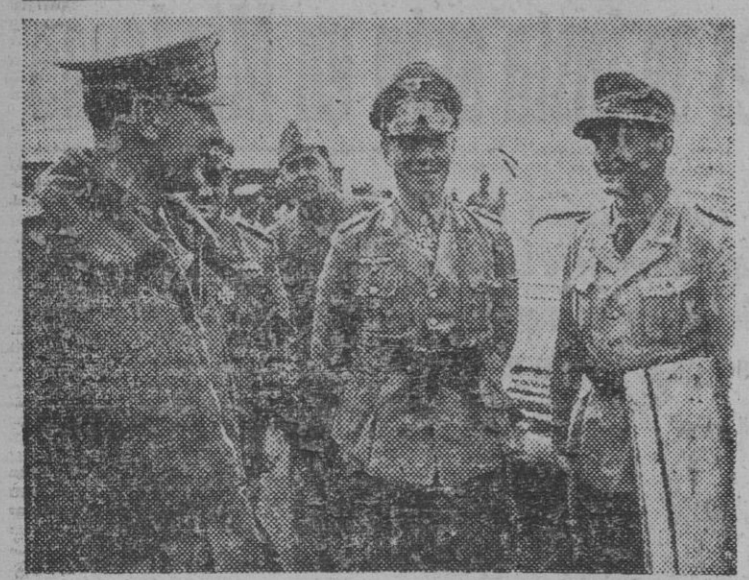
El mariscal Rommel, héroe de la guerra en los campos africanos conversando en un aeropuerto con oficiales alemanes e italianos