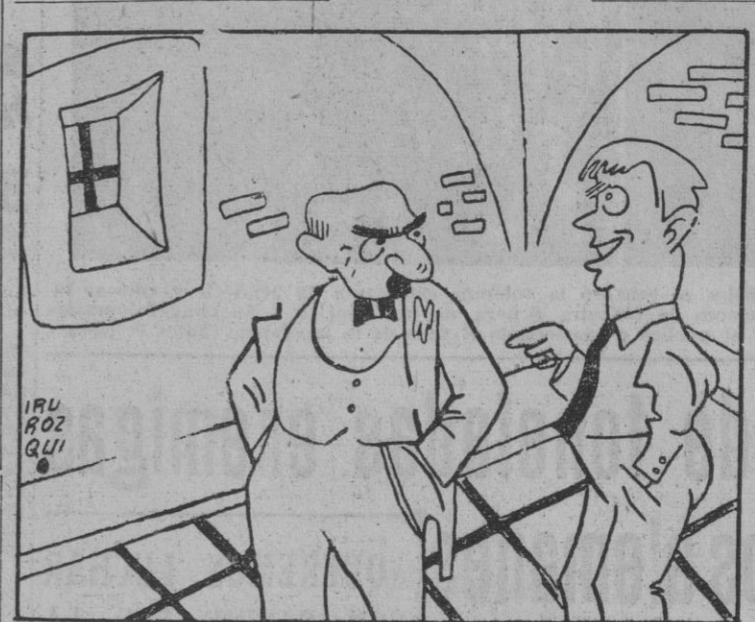
—Antes las astas de los toros se desinfectaban con limón. —Si; pero ahora según dicen de Valencia, se utiliza la lima.