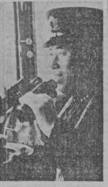
El almirante Isoroku Yamamoto, comandante en jefe de la flota imperial japonesa.