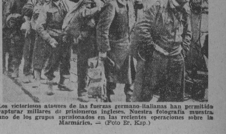
Los victoriosos ataques de las fuerzas germano-italianas han permitido capturar millares de prisioneros ingleses. Nuestra fotografía muestra uno de los grupos apresionados en las recientes operaciones sobre la Marmárica.