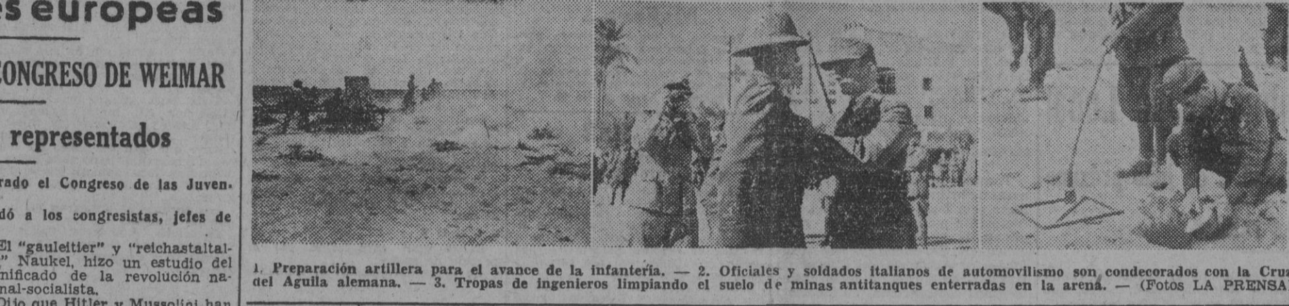
1. Preparación artillera para el avance de la infantería. — 2. Oficiales y soldados italianos de automovilismo son condecorados con la Cruz del Águila alemana. — 3. Tropas de ingenieros limpiando el suelo de minas antitanques enterradas en la arena. — (Fotos LA PRENSA)