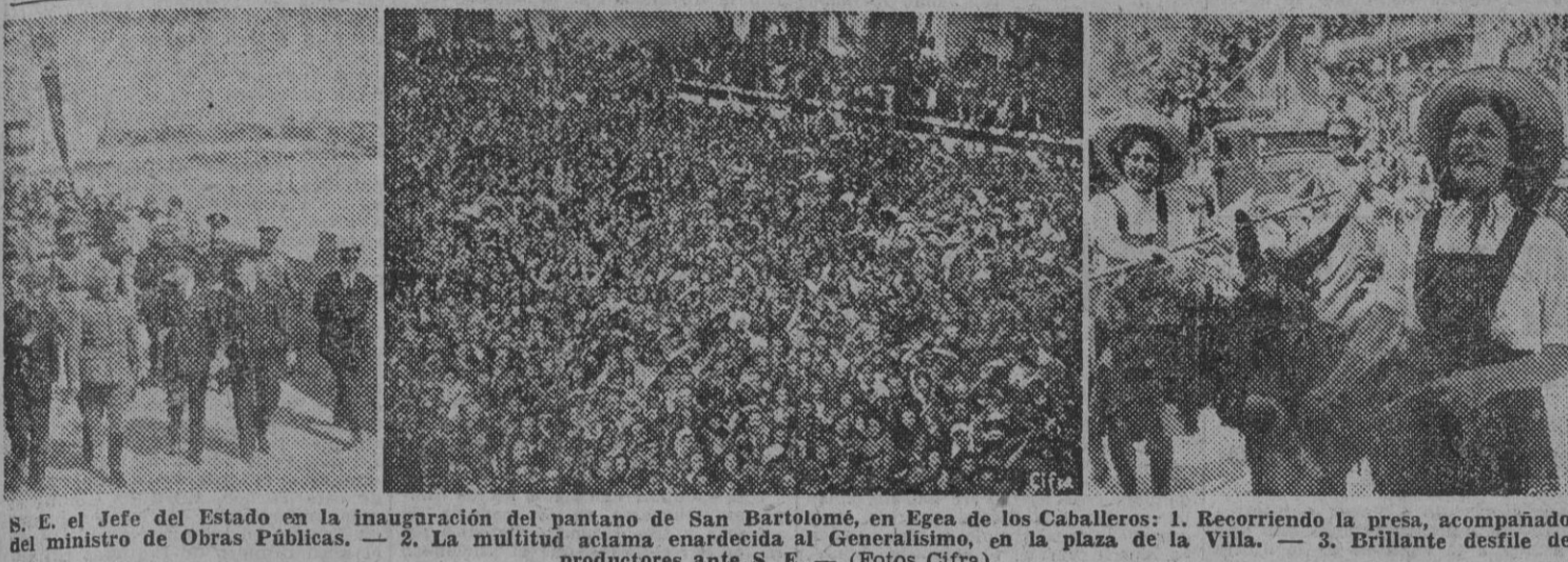
S. E. el jefe del Estado en la inauguración del pantano de San Bartolomé, en Egea de los Caballeros: 1. Recorriendo la presa, acompañado del ministro de Obras Públicas. — 2. La multitud aclama enarbolada al Generalísimo, en la plaza de la Villa. — 3. Brillante desfile de productores ante S. E.