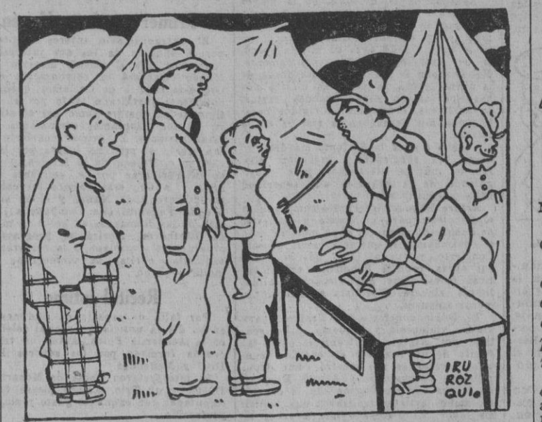
EL SERGENTO: «¿Y tú qué alegas para negarte a ir a la guerra? EL GANGSTER: «Mi promesa formal al último jefe que me confió. Le juré que no tomaría jamás un arma en mis manos.»

48.000 millones de dólares llevan concedidos por la Ley de «Préstamo y Arriendo» LA CIFRA PREOCUPA GRAVEMENTE AL INSTITUTO DE ESTUDIOS FISCALES Se temen las consecuencias futuras de dicha ley