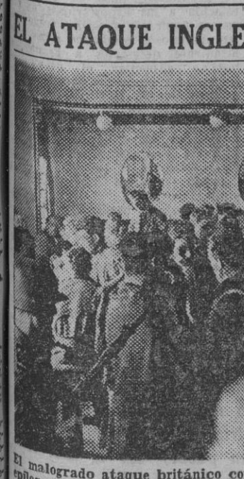
El malogrado ataque británico contra la base de Saint Nazaire...