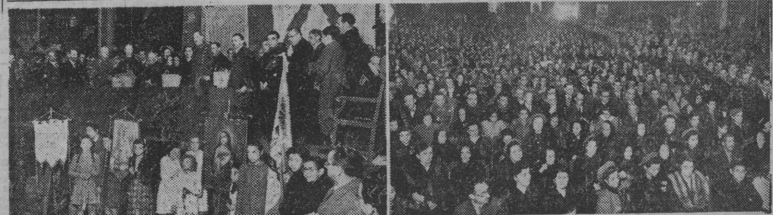
En la vecina localidad de Hospitalet de Llobregat, se ha celebrado esta mañana con diversos actos el XXVI Homenaje a la Vejez...