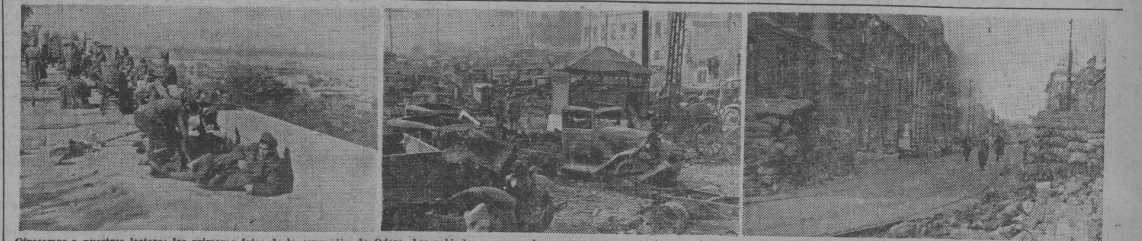
Ofrecemos a nuestros lectores las primeras fotos de la ocupación de Odesa. Los soldados rumanos descansan, unos momentos, en el puerto. — He aquí una mínima parte del botín cogido. — Las calles de Odesa estaban todas preparadas para defenderlas; aquí vemos barricadas en los edificios y calles, que no impidieron la toma de la ciudad. — (Fotos Orbis)