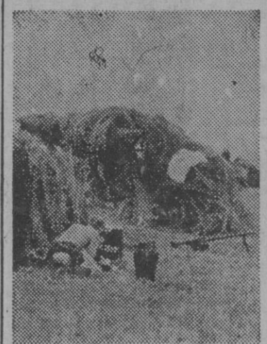
Tanquistas alemanes durante un corto descanso en su marcha contra Moscú.