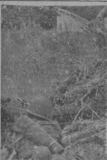
Un núcleo de resistencia soviético es atacado por patrullas del Cuerpo de Expedición italiano en Rusia