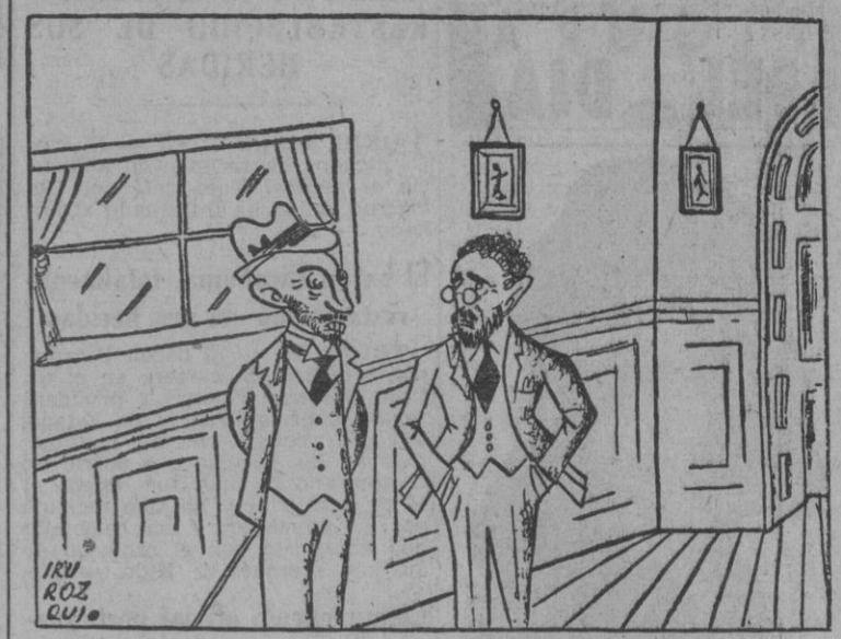
ISAAC: La vida se me hace muy dura de llevar. SAMUEL: Pues ponte un gasógeno.