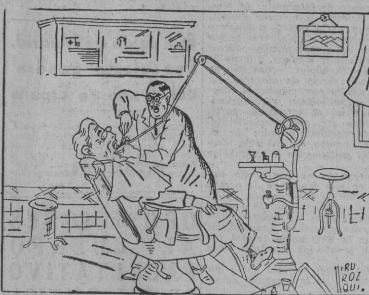
Roosevelt: — ¿Qué ve usted? El dentista: — El exterior bueno, pero en el fondo veo un destróyer, dos submarinos, un mercante y cuatro petroleros.