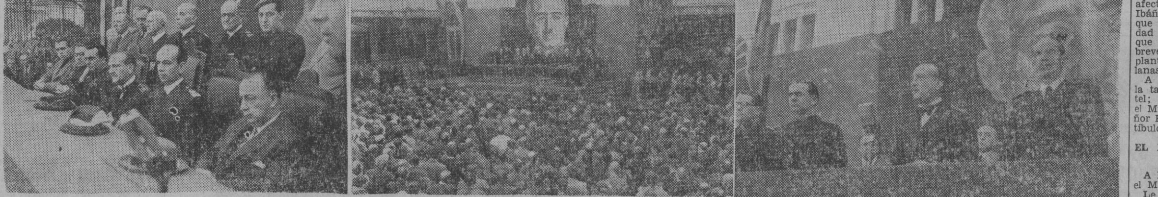
Los productores ferroviarios han celebrado esta mañana un grandioso acto de adhesión al Gobierno por las mejoras económicas concedidas, siendo presidido por el Ministro de Obras Públicas. Nuestras fotos reproducen tres momentos del mismo: la presidencia, asistentes y el Ministro de Obras Públicas durante su discurso. — Foto P. de Rozas