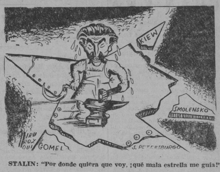
STALIN: "Por donde quiera que voy, ¡qué mala estrella me guía!"