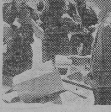
Soldados alemanos del Cuerpo expedicionario en el África, haciendo compras en zocos instalados en pleno desierto.