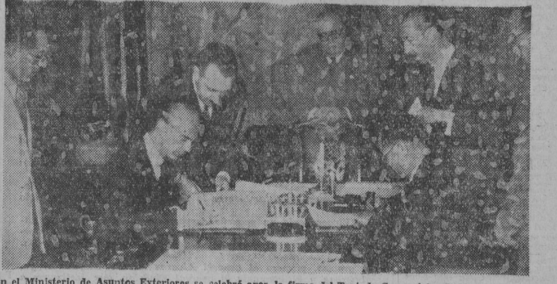
En el Ministerio de Asuntos Exteriores se celebró ayer la firma del Tratado Comercial y de Navegación entre España y el Manchukuo.