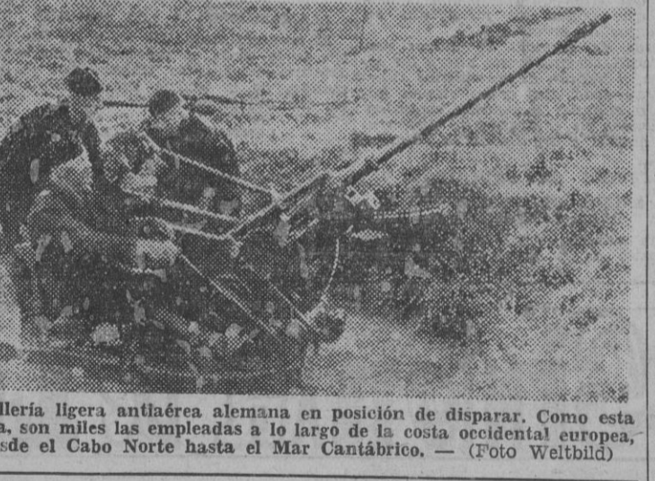
Artillería ligera antiaérea alemana en posición de disparar. Como esta pieza, son miles las empleadas a lo largo de la costa occidental europea, desde el Cabo Norte hasta el Mar Cantábrico.