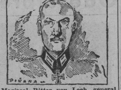
Mariscal Ritter von Leeb, general en jefe de los Ejércitos alemanes que sitian San Petersburgo.

La flota roia acorralada en el sector más retirado de la bahía finlandesa