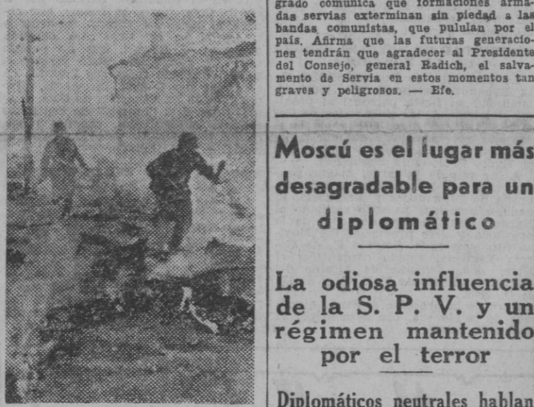
La vanguardia de las tropas alemanas toman al asalto las primeras casas de una aldea rusa.