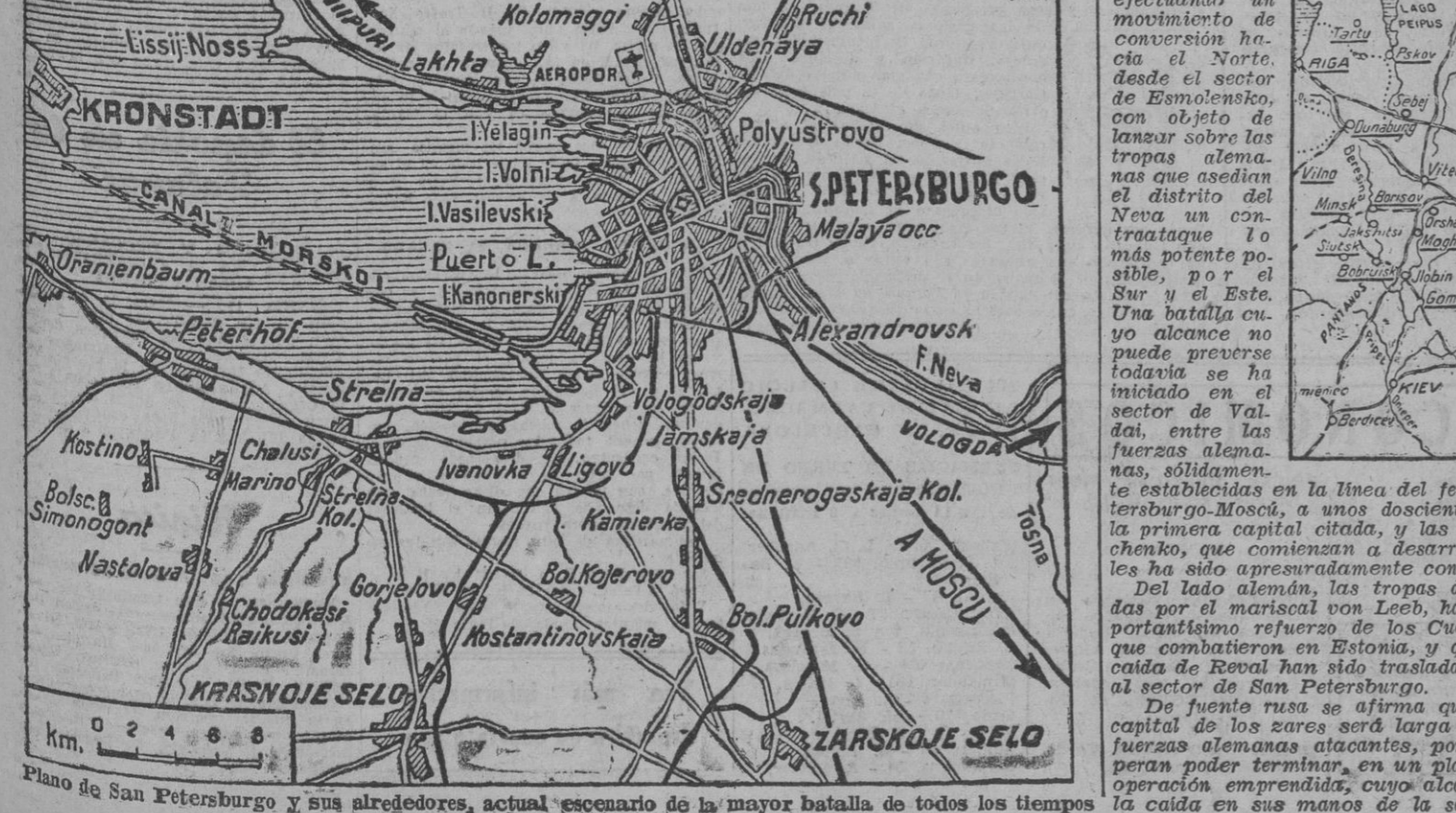
Plano de San Petersburg y sus alrededores, actual escenario de la mayor batalla de todos los tiempos