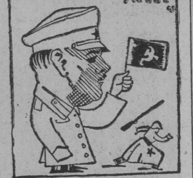
Mariscal rojo Vorochilov, jefe de las fuerzas rojas sitiadas en la capital de los Zares.

Dos buques de línea, seis cruceros, treinta contratorpederos y cien submarinos, sin salida