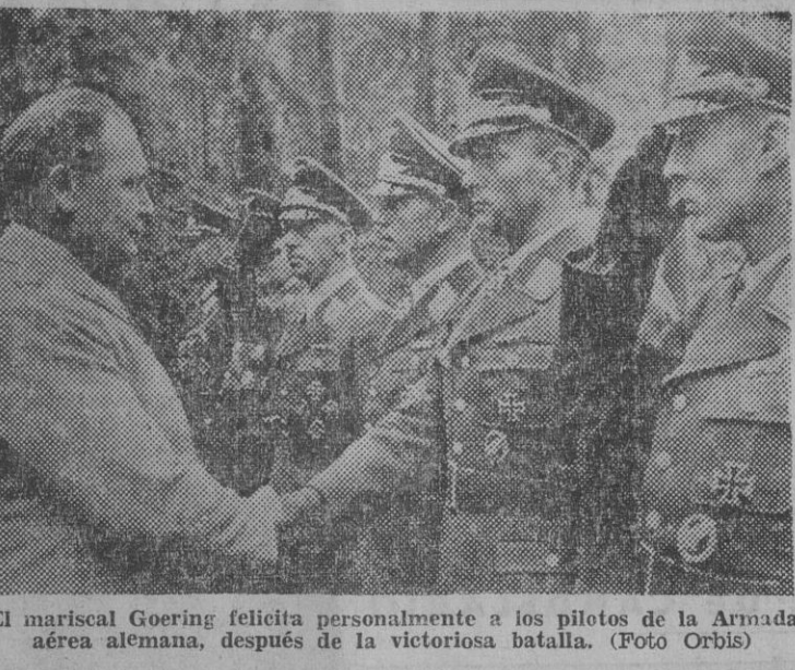
El mariscal Goering felicita personalmente a los pilotos de la Armada aérea alemana, después de la victoriosa batalla.

Valladolid, 24. — El V aniversario de la muerte de Onésimo Redondo ha sido conmemorado por la Falange vallisoletana con varios actos sencillos y profunda emoción. La misa que diariamente se celebra por los Caídos de la Falange fue hoy aplicada por el eterno descanso del fundador de las J. O. N. S. castellanas. En Quintanilla de Abajo, pueblo natal de Onésimo Redondo, se celebró un funeral, y se hizo una ofrenda de coronas por F. E. T. y de las J. O. N. S. de Valladolid. Por la tarde, las ferrietas de los distintos servicios del Movimiento visitaron oficialmente el mausoleo levantado en el cementerio municipal, donde descansan los restos de Onésimo Redondo. Durante todo el día, camaradas de la Falange dan guardia de honor en la tumba. — Cifra.