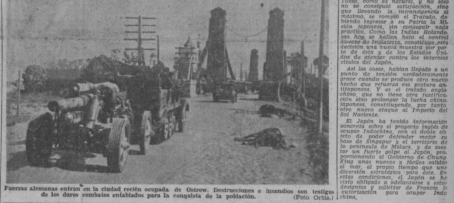
Fuerzas alemanas entran en la ciudad recién ocupada de Ostrow. Destrucciones e incendios son testigos de los duros combates entablados para la conquista de la población.