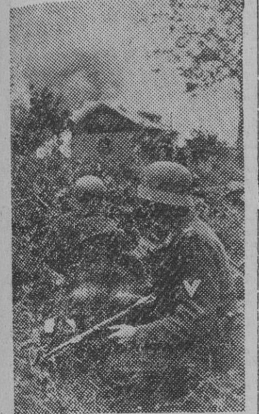
Soldados alemanes reduciendo un foco de resistencia bolchevique, donde ya ha prendido el fuego de los lanzallamas.