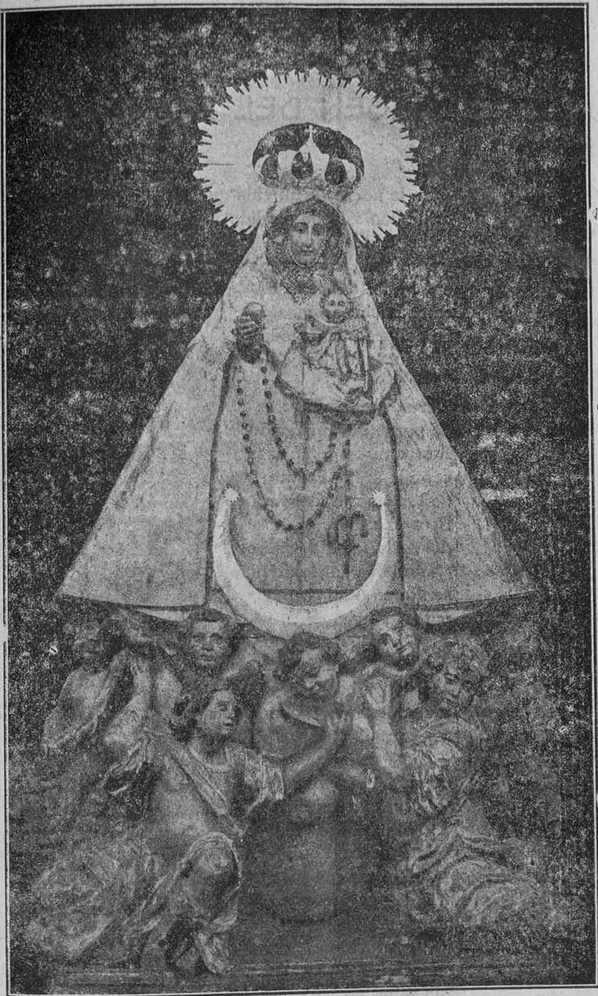
NUESTRA SEÑORA DEL ROSARIO SEGÚN SE VENERA EN LA IGLESIA DE LOS PP. DOMINICOS DE LAS CALDAS