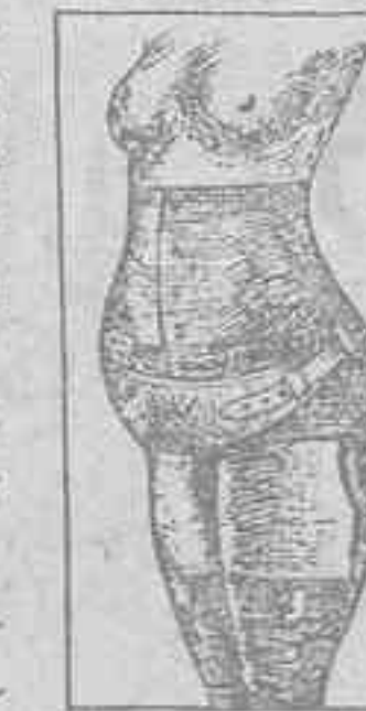
CENIDOR DE PRECISION