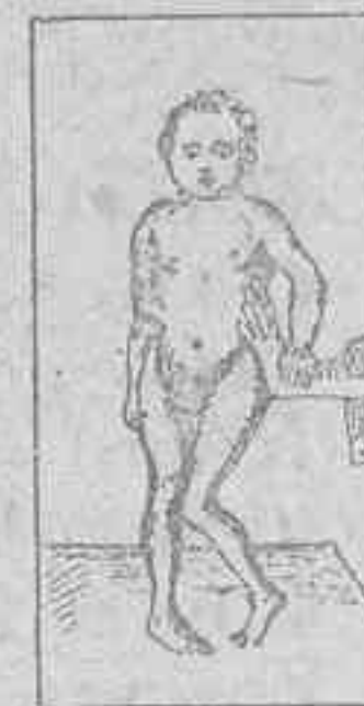
ENFERMEDAD DE LITTE