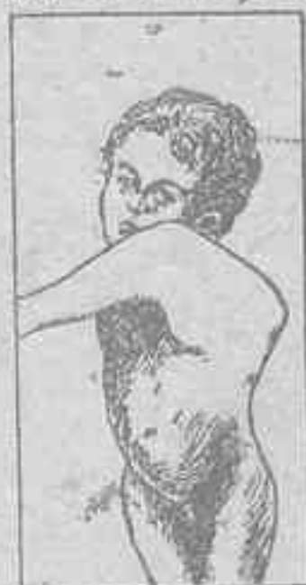
MAL DE POTT con GIBOSIDAD