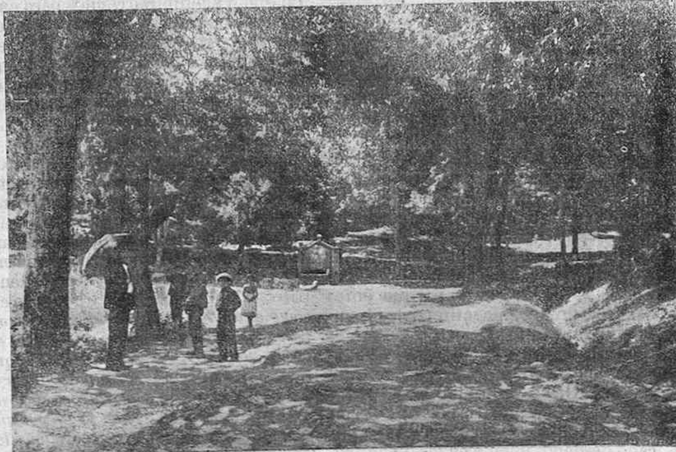
El Cañal: Camino de la Plaza de Toros