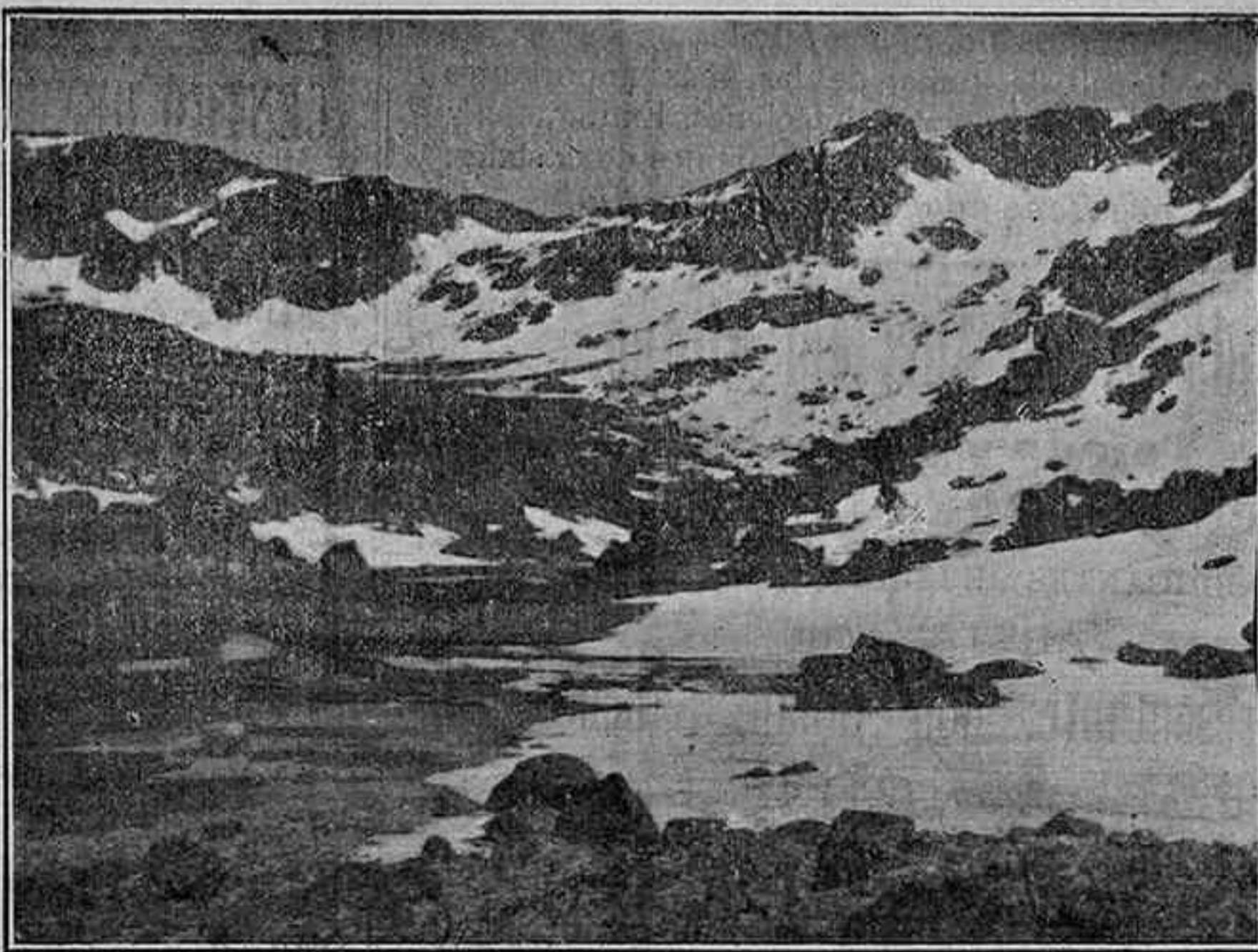
Nacimiento del río «Cuerpo de Hombre» en «Hoya Moro»

Se manifiesta en Hoya Moros el muy escabroso Parral, llamado así por la multitud de canchales que exis-