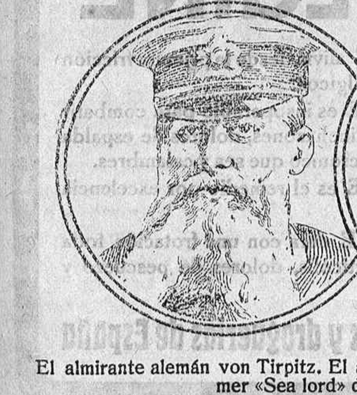
El almirante alemán von Tirpitz. El almirante inglés sir John Jellicoe, primer «Sea lord» del Almirantazgo.

presenta exactamente el efecto principal de la campaña submarina; lo que se persigue, ante todo, es intimidar á la marina mercante neutral, la cual, si dejara de navegar, privaría á la Gran Bretaña de los alimentos indispensables. Los ingleses aseguran, con todo, que se trata de un nuevo bluff alemán y se disponen á ofrecer á los neutrales el máximo de protección que pueden prestar sus poderosos medios navales para atender ó desvanecer en lo posible el efecto de la amenaza en que ponen su esperanza los alemanes. Sin embargo de haber transcurrido casi un mes desde que Alemania inició la campaña submarina preconizada por el almirante Tirpitz, no creemos aún llegado el momento de juzgar sus resultados y menos aún de apreciar la eficacia de los medios adoptados por el primer «Sea lord» del Almirantazgo británico, sir Jellicoe, para limpiar los mares de submarinos enemigos. X. X.