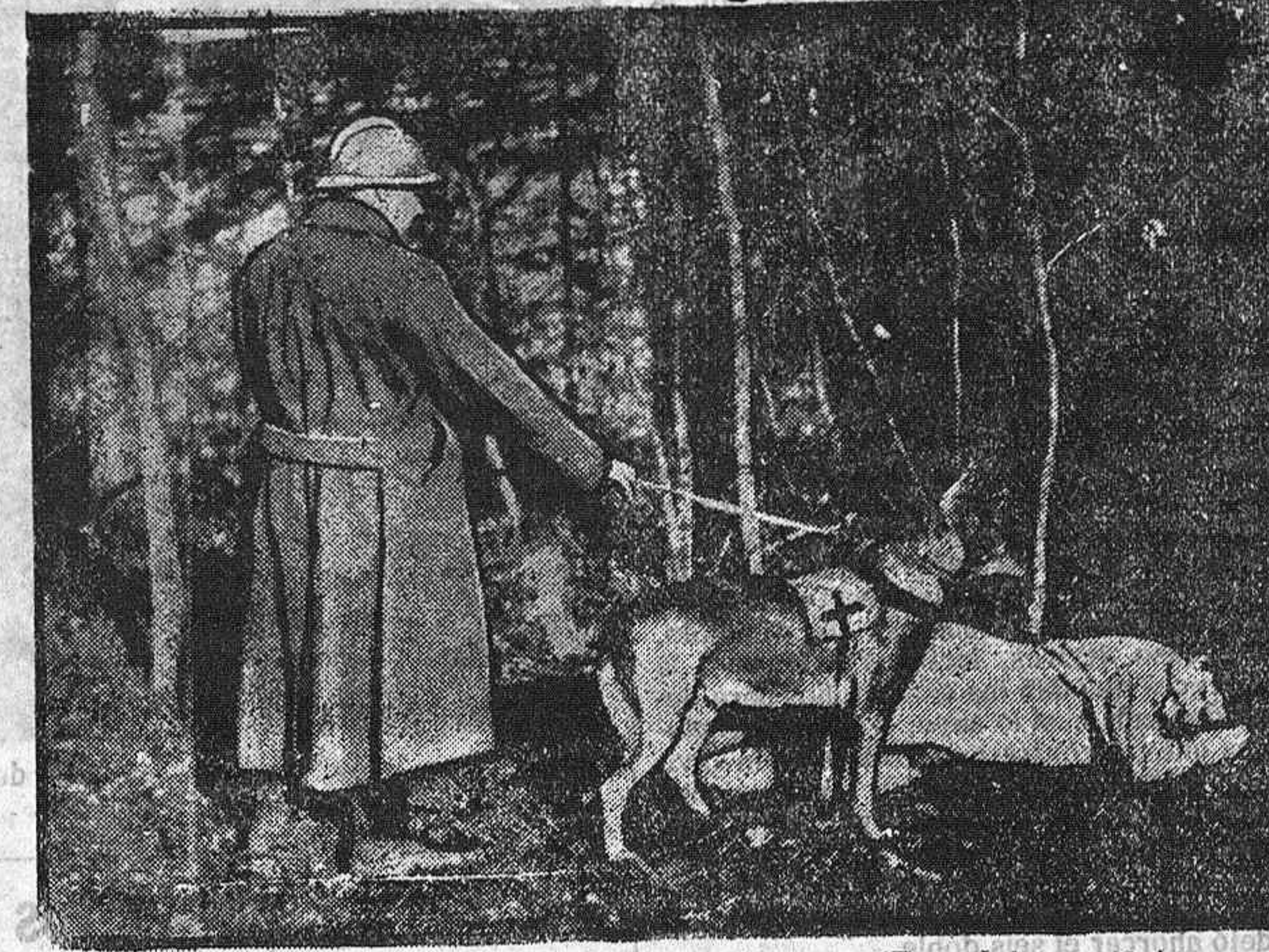
Notas gráficas de la guerra.-Perros sanitarios.-(Foto Información).

¡Dios nos coja confesados, lector amigo, y de que su mano nos tenga mientras nuestro florido Ayuntamiento proyece economías!