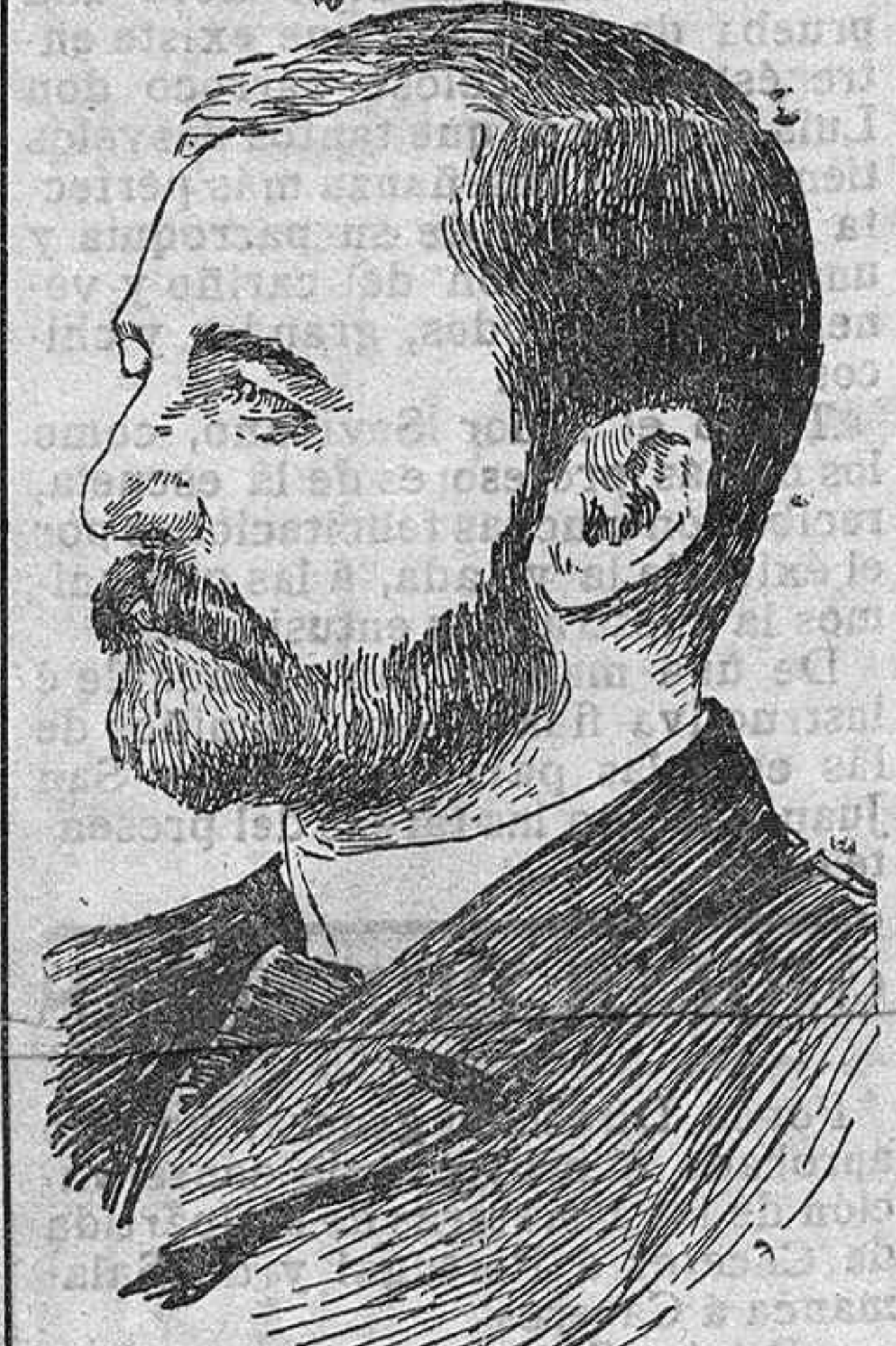
El conde Tisza.

Por causa de la sentencia absoluta dictada en un proceso, de que no ha salido muy bien librada su honorabilidad, el primer ministro de Hungría, Lukaes, se ha visto preci-