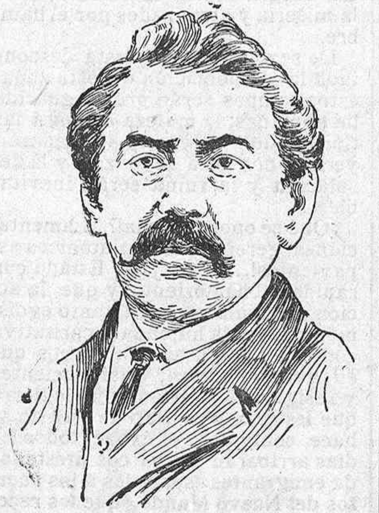
Monsieur Briand, presidente del nuevo Consejo de ministros francés.